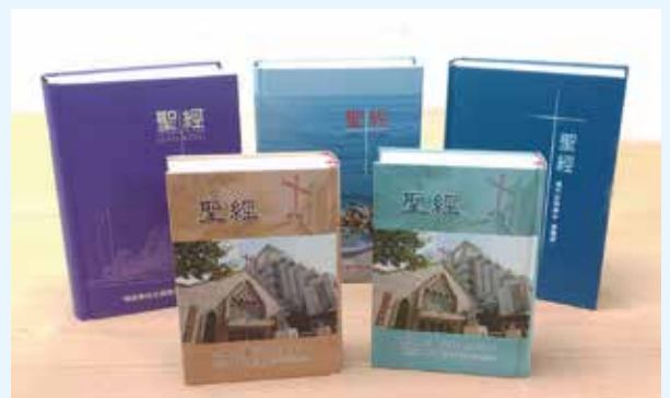
客製化聖經的訂單，這反映出市場對這類產品的需求。

美、功能多樣的紙本聖經，以滿足不同受眾的需求。例如，即將推出針對家庭的家庭聖經，加入互動性內容，讓親子間能共同學習。此外，面對高齡化的社會，推出的大字版聖經特別受到歡迎，讓年長者的閱讀變得更加輕鬆。在所有紙本聖經的銷售中，大字版聖經的銷量甚至出現上升趨勢。