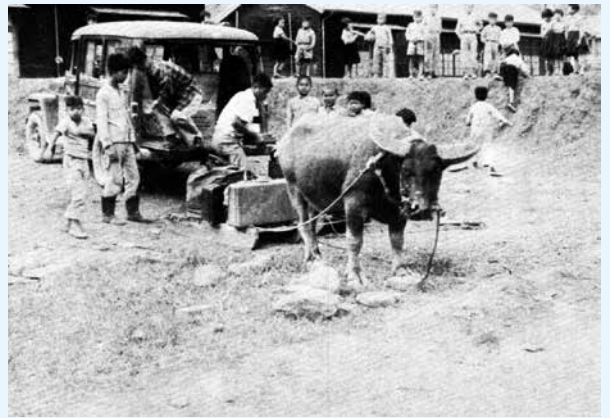
本會早期山地佈道隊之裝備，由牛車運聖經轉進入山地。 (原刊登於台灣聖經公會20週年紀念特刊1977年年報)

我們也誠懇地期待更多人能承接這份神聖的使命薪火，讓聖經公會在恩典中永續經營。藉著你我的服事和奉獻支持，讓上帝的道成為世界的光。✉