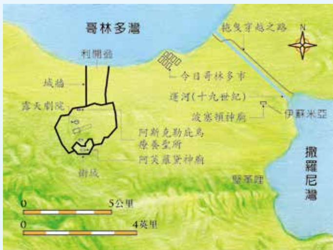
主後一世紀的哥林多與其它相關地理位置

此後，哥林多雖仍有人煙，但已不復過去的榮耀。主前44年，凱撒（Gaius Julius Caesar，主前約100-44年）下令將該城重建為一羅馬的殖民地，從各地移入不同種族的人，哥林多才重新恢復其榮耀，但這新的哥林多已不再是一希臘文化的城