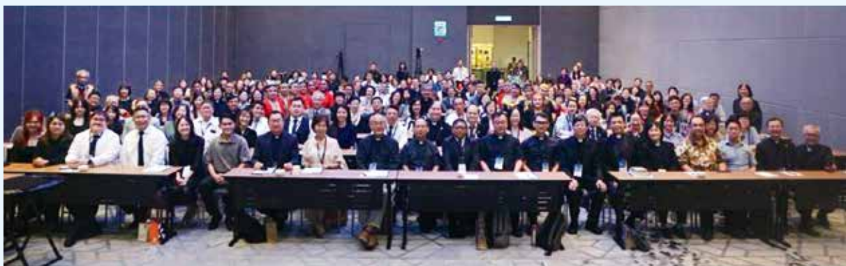
2024/9/24-26 第十屆新馬台泰印港六國聯合教牧長執激勵營（馬來西亞 馬六甲）

◎請響應環保，歡迎上網瀏覽，要停止寄送敬請來電告知。(02-2664-9909 分機153或155) 或寄E-mail: service@bstwn.org