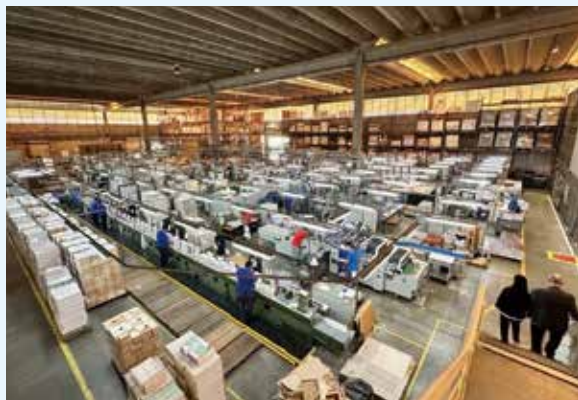
2024/10/15 探訪巴西聖經公會及其印刷廠

本期《現代人福音季刊》特別邀請聖經公會各部門分享他們事工中的溫馨故事。希望讀者透過這些感人的記載，更深入地了解聖經公會在翻譯、推廣及宣教事工上的努力，進而更全面地認識我們的使命與異象。