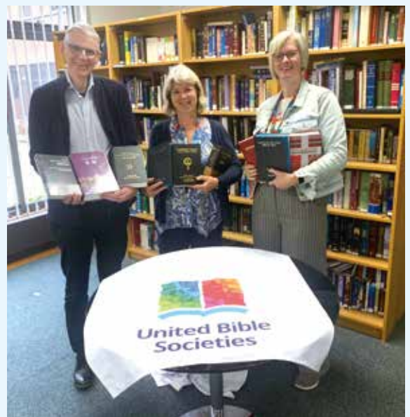
聯合聖經公會總部（Swindon, 英國），全球事工部三位同工手持九本聖經欣喜合影。