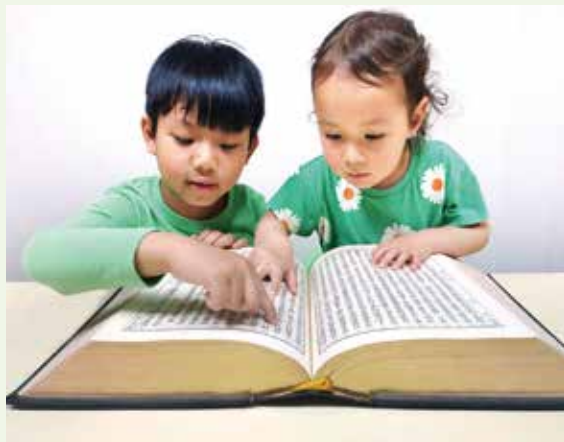
教導兒童走正路，他自幼到老終生不忘。箴言22章6節

長輩牧者曾說過，教會可以沒有團康吃喝玩樂，但是絕對不能沒有查經班。禮拜聚會形式有很多種，然而，聖經—上主的話才是能讓我們認識基督信仰最核心的關鍵。道成肉身的耶穌，是道路、是真理也是生命，願我們每一個已是耶穌基督跟隨者，繼續努力傳揚福音，並且一起支持把可以負擔的起、讀得懂並且信得過的聖經送到每一個人的手中。✉