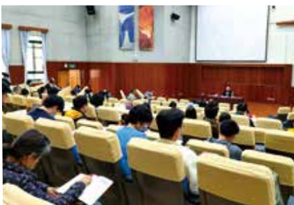
▲2022/12/5-7 聖經詮釋營(提摩太前後書/提多書)—長老會新竹聖經學院