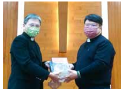
▲2023/1/29 異象傳遞—朴子長老教會