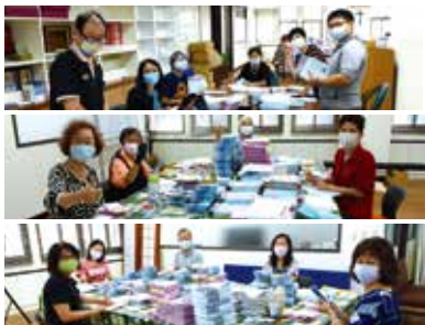
▲2022/11/21 志工寄發季刊—本會