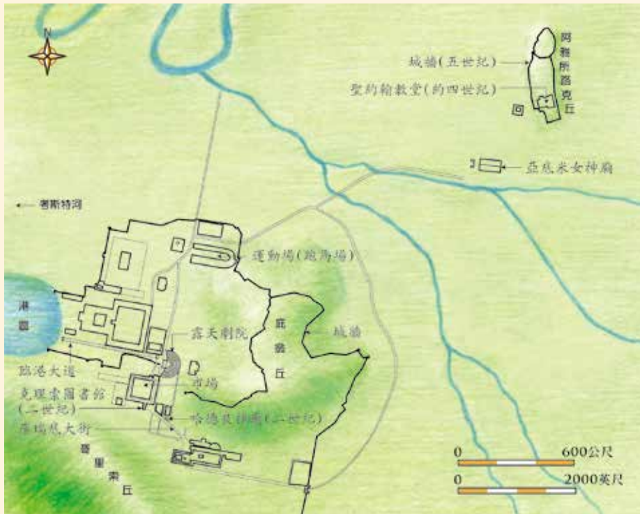
主後一世紀的以弗所