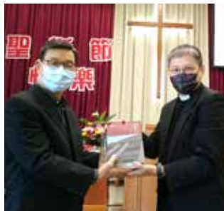
▲2022/12/11 異象傳遞—沙鹿神召會