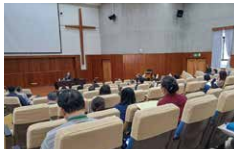
▲2023/2/13-15 聖經詮釋營(雅各書)—長老會新竹聖經學院