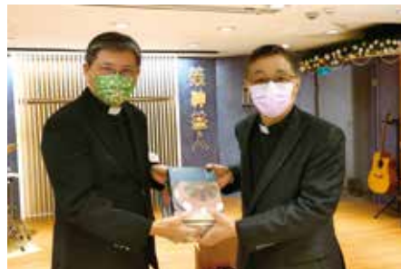
▲2023/2/5 異象傳遞—東湖長老教會