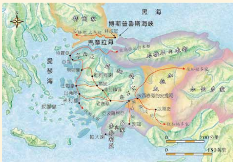
主後一世紀的以弗所與其它相關地理位置

主後29年，以弗所成為亞細亞省的首府，海陸交會的地理位置，令城市勃興，以弗所本身具有良好的港口，是愛琴海東側重要的口岸，此地亦是羅馬大道路網的匯集之處：向北可經士每拿、別迦摩，直到亞朔與特羅亞，向南可前往米利都，更可遠達帕大喇，而