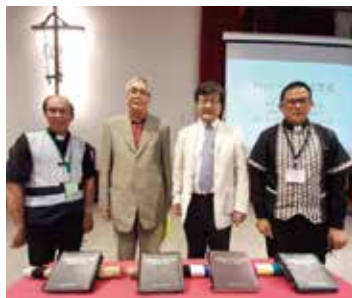
▲2023/2/9 泰爾雅聖經出版感恩禮拜—玉山神學院