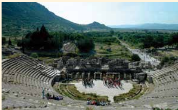
從以弗所的露天劇院遙望臨港大道

對英雄人物的尊崇與崇拜，在主後一世紀的以弗所亦非常盛行。當地所尊崇的英雄，包括希臘傳說中的建城者安得羅克洛、意圖重建亞底米女神廟的亞歷山大，