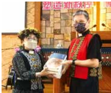
▲2022/11/20 異象傳遞—茂林長老教會