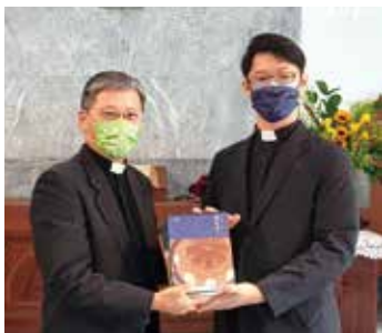
▲2022/11/13 異象傳遞—衛理公會恩友堂