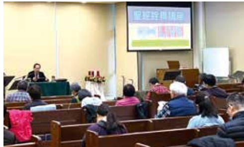
▲2022/12/17 聖經詮釋講座〈從加拉太書、馬太福音、羅馬書談福音〉—台北和平長老教會