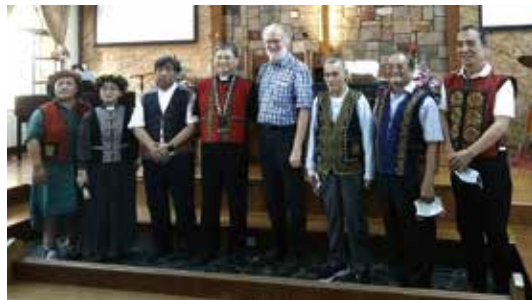
▲2022/11/20 魯凱族三族語翻譯馬可福音簽約—茂林長老教會