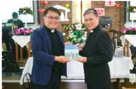
▲2022/12/4 異象傳遞—霧峰長老教會