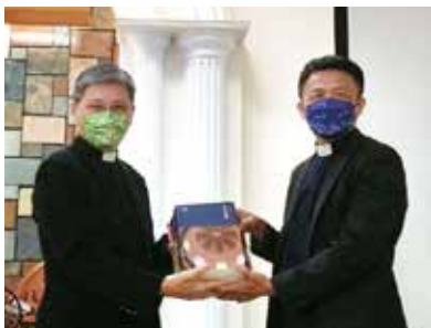
▲2022/12/18 異象傳遞—竹田長老教會