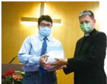
▲2022/11/27 異象傳遞—中國信義會聖愛堂