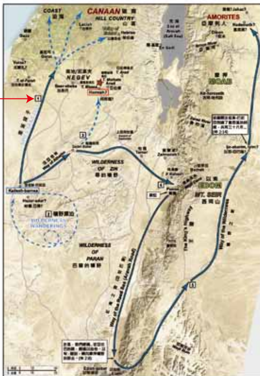
3-2 流浪曠野 (約公元前 1448-1406 年)