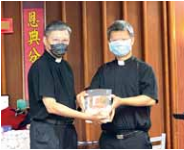
▲2022/9/18 異象傳遞—衛理公會板橋榮恩堂