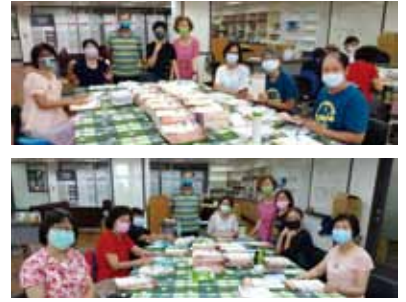
▲2022/9/5 志工寄發季刊—本會