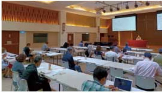
▲2022/9/3 聖經詮釋講座(詩篇選讀)—和平長老教會