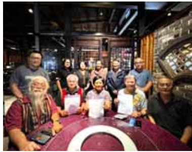
▲2022/9/30 鄒語聖經翻譯展延簽約—嘉義