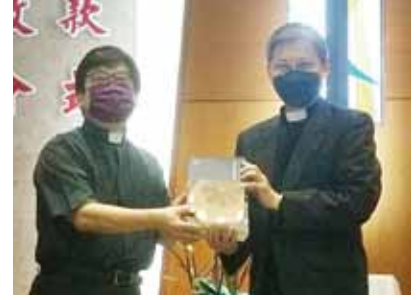
▲2022/10/16 異象傳遞—大溪長老教會