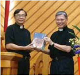
▲2022/8/28 異象傳遞—竹南長老教會