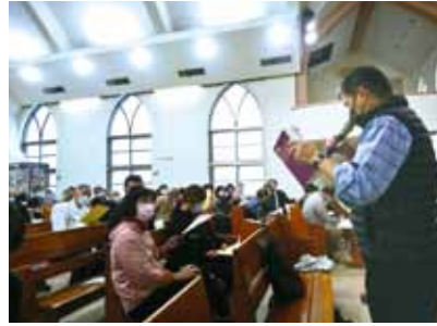
▲2022/10/15 「現代台語翻譯與宣講聖經研習會」 (台北場)—士林長老教會