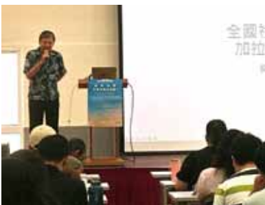
▲2022/10/22 全國社青讀經營—新竹聖經學院