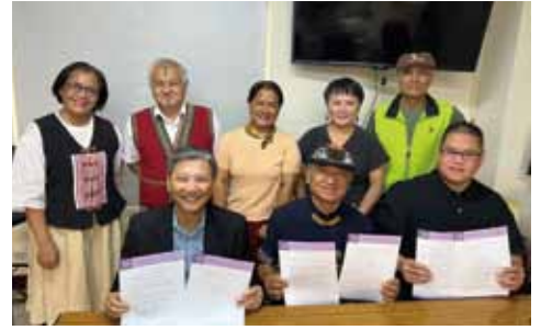
▲2022/10/11 排灣語聖經翻譯展延簽約—排灣中會事務所