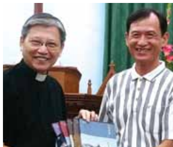
▲2022/10/23 異象傳遞—苗栗公館長老教會