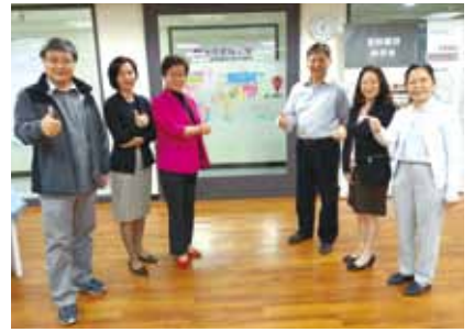
▲2021/3/10 國際讀經會台灣總會同工來訪—本會