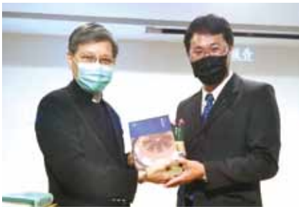
▲2021/2/21 異象傳遞—改革宗長老會東光教會—台北