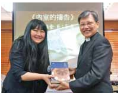
▲2021/4/18 異象傳遞—龍岡長老教會—桃園