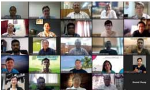
▲2021/3/29-30 聯合聖經公會行銷網路研討會—各國