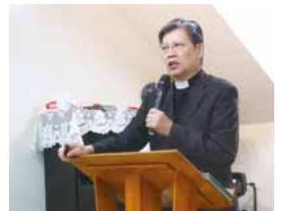
▲2021/4/25 異象傳遞—龜山懷恩教會—桃園