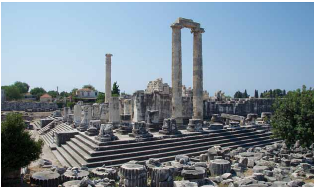
低士馬阿波羅神廟遺跡