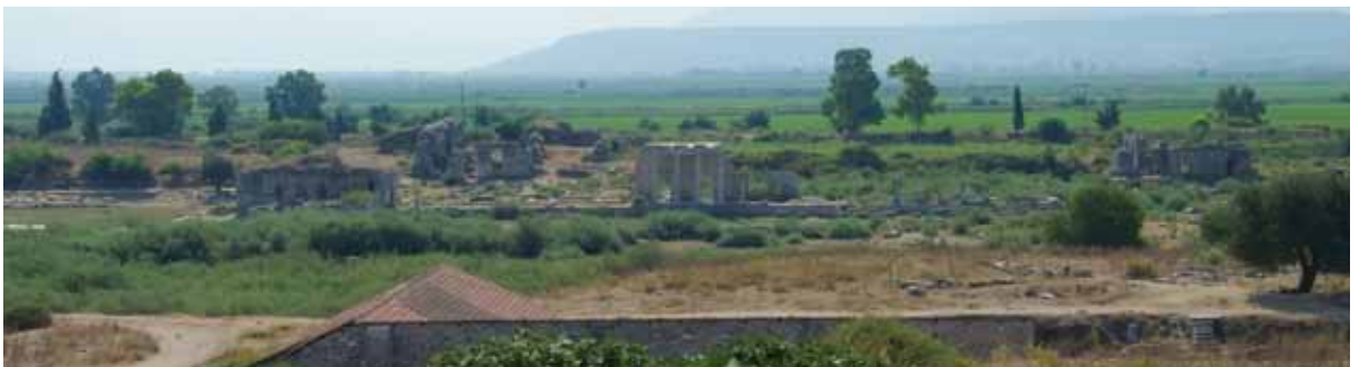
米利都城中南北向「典禮大道」的遺跡

在宗教方面，自愛奧尼亞人來到此地起，米利都即為愛奧尼亞一帶重要的阿波羅崇拜中心，朝聖者來到此地，除到城內港灣附近的岱爾菲聖所（Delphinion）敬拜外，還會沿城南的「神聖大道」，到約18公里（約11英里）外低土馬（Didyma，見地圖）宏偉的阿波羅神廟，求問阿波羅的神諭。在希臘世界中，低土馬的阿波羅神諭，其重要性僅次於亞該亞北部岱爾菲