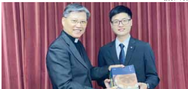
▲2021/5/2 異象傳遞—福音浸信會新生南路教會—台北