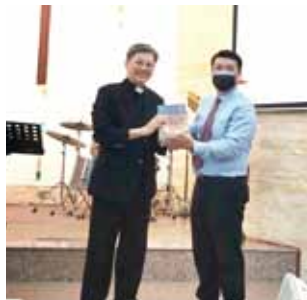
▲2021/4/11 異象傳遞—浸信宣道會 虎尾教會—雲林