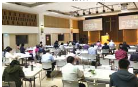
▲2021/4/24 聖經詮釋講座〈以色列先知的傳統與沿革〉 —台北和平長老教會