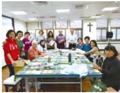
▲2021/3/8 志工寄發季刊—本會