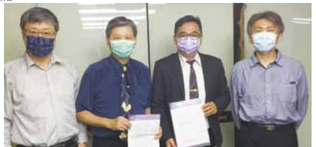
▲2021/5/20 現代台語譯本漢羅版聖經簽約—台灣基督長老教會總會—台北