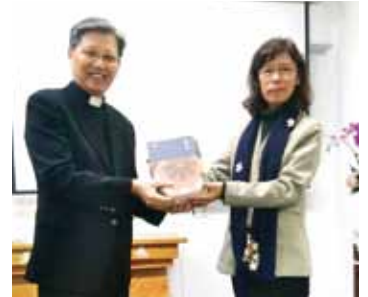
▲2021/3/21 異象傳遞—石牌浸信會—台北