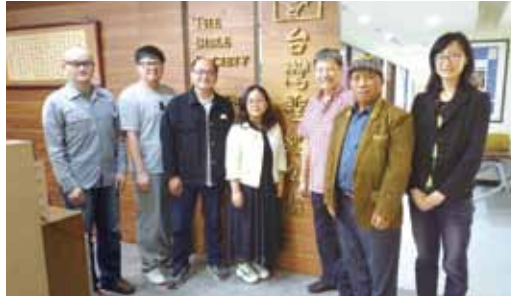
▲2021/3/19 魯凱馬可福音〈茂林、萬山、多納語〉排版會議—本會