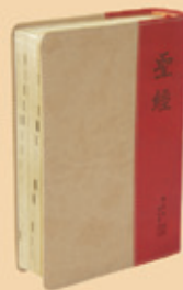
和修中型神金邊 RCU64A 八折特價 560元 (原價700元)