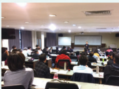
▲2019/3/4-6 聖經詮釋營(創世記)—高雄