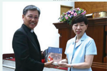
▲2019/5/19 異象傳遞—左營國語禮拜堂