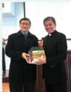
▲2019/3/17 異象傳遞—華城行道會