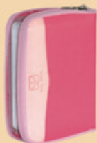
和合袖珍神 拉鍊膠面 CU36APUZB 六折特價 390元 (原價650元)