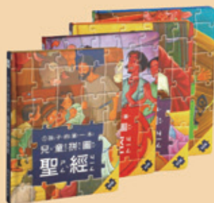
中文拼圖聖經1~4集+貼紙故事書 KIDSPUZZLE-C-SET 整套特價 1,200元 (原價1,750元)