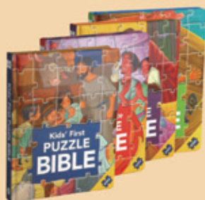
英文拼圖聖經1~4集+貼紙故事書 KIDSPUZZLE-E-SET 整套特價 1,200元 (原價1,750元)