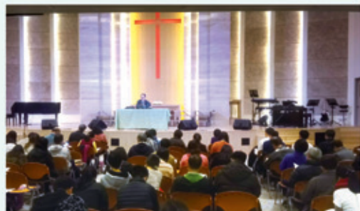
▲2019/3/23 聖經詮釋講座(歌羅西書/腓利門書)—新竹北門聖教會