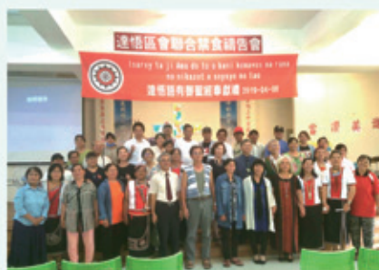
▲2019/4/8 達悟區新約聖經錄音完成 感恩禮拜—蘭嶼