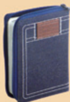
現中輕便型 拉鍊牛仔 TCV055PJZ 八折特價 560元 (原價700元)