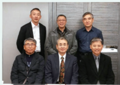
▲2019/4/3-5 東北亞總幹事聯盟—日本