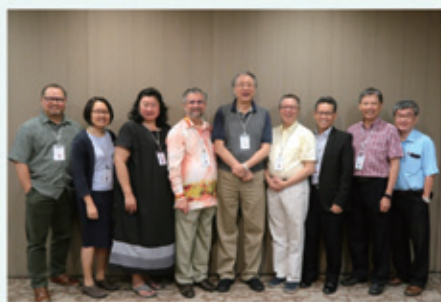
▲2019/3/6-9 中文聖經協商會議—馬來西亞