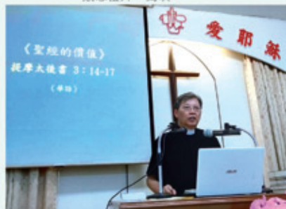
▲2019/4/28 異象傳遞—高雄宣道會內性堂