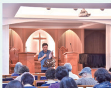
▲2019/4/13 以色列聖經特會行前說明 —台北北門教會