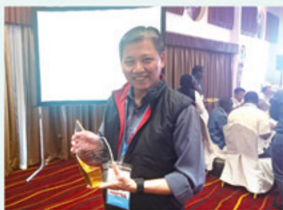
▲2019/2/25-28 聯合聖經公會出版大會—肯亞