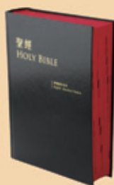
標準英文新標和合 對照黑硬面 ESV/CUNP63DI 八折特價 600元 (原價750元)