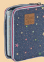
和合袖珍神 拉鍊星光 CU35ASTR 六折特價 420元 (原價700元)