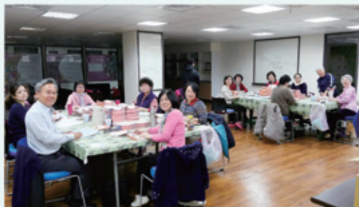
▲2019/3/11 志工團協助寄季刊—聖經公會