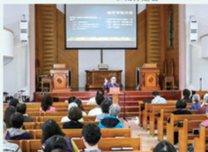
▲2019/3/30 以色列聖經特會行前上課—士林教會