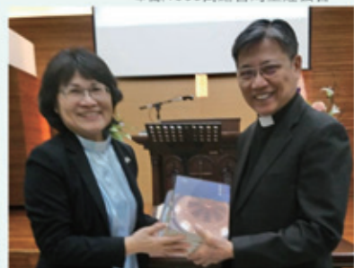
▲2019/5/5 異象傳遞—台中向上聖教會