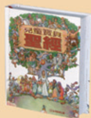
兒童寶貝聖經- 人物故事 TCPS-C63P 八折特價 560元 (原價700元)