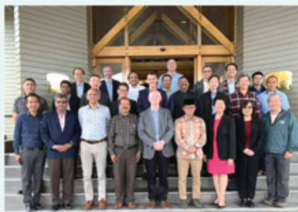
▲2019/3/25-28 亞太區總幹事聯盟—紐西蘭