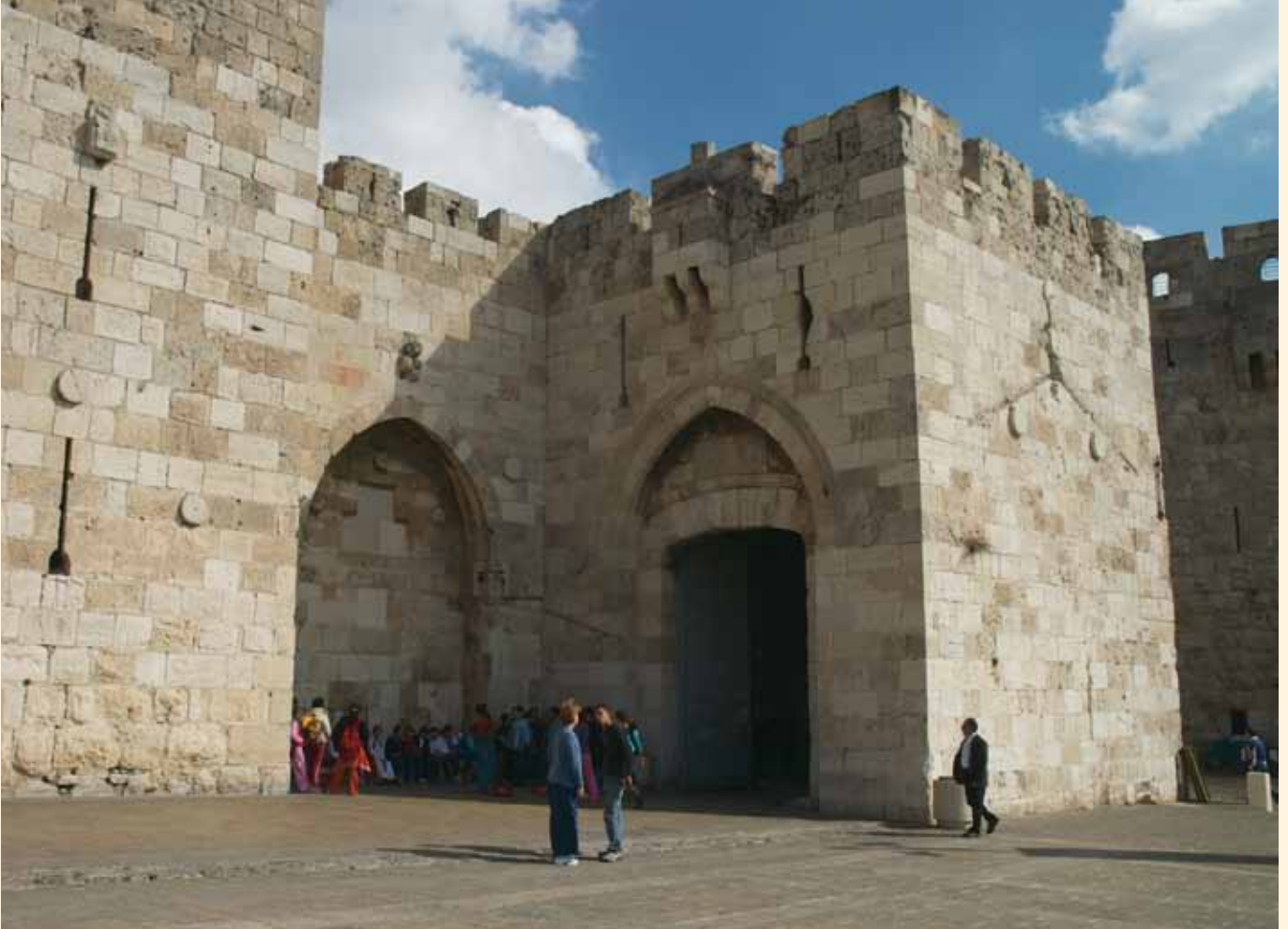
耶路撒冷舊城朝西的「約帕門」。該門自古以來為耶路撒冷前往約帕並沿海大道的門戶，從約帕可向西航行至地中海各地，從沿海大道向南可達埃及，向北可往沙崙平原與腓尼基人之地（如泰爾〔推羅〕、西頓）。

法條所規範的，包括不可獻祭給偶像（利17:7），不可吃血（利17:10-14），也不可吃被野獸撕裂的活物（利17:15），因此相對應的，便是在飲食方面要禁戒「祭偶像之物」與「勒死的牲畜和血」，而利18:6-18不可亂倫的律法，以及利18:20不可通姦的律法，則與禁戒「姦淫」有關。按此背景，耶路撒冷會議的附帶要求，有兩種可能的目的：(A)由於當時歸主的外邦人多參與猶太會堂的聚會，他們的處境與寄居以色列家中間的外人類似，因此他們須受到上述飲食與性道德律