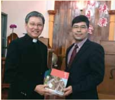
▲2018/02/25 異象傳遞—墩仔腳長老教會