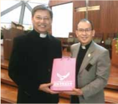
▲2018/04/22 異象傳遞—三芝雙連安養中心