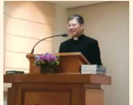
▲2018/03/18 異象傳遞—浸信宣道大安教會