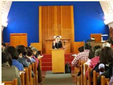
▲2018/03/10 聖經詮釋講座—台北東門長老教會