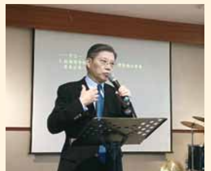
▲2018/04/11 異象傳遞—神召會神學院