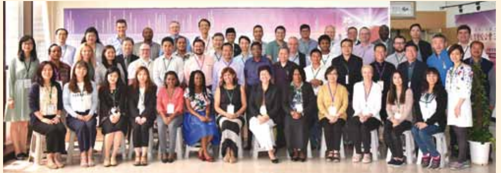
▲2018/04/23-27 UBS Digital Academy 聯合聖經公會數位學院—台灣聖經公會