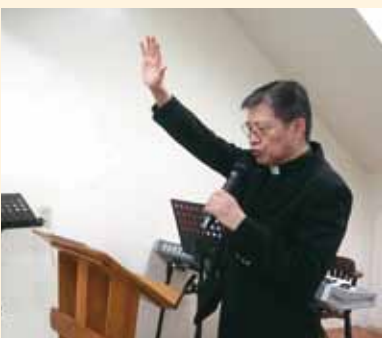
▲2018/04/01 異象傳遞—龜山懷恩教會