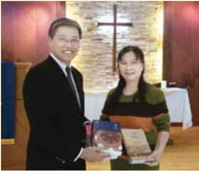
▲2018/02/21 異象傳遞—衛理神學研究院