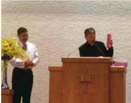
▲2018/03/04 異象傳遞—新店長老教會