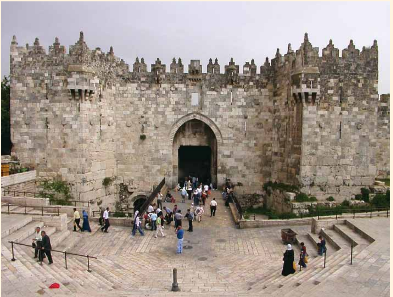
耶路撒冷舊城朝北的「大馬士革門」。該門自古以來為耶路撒冷沿山區或約旦河河谷前往北方與死海的門戶，向北可經加利利地區前往大馬士革，向東可至耶利哥與死海。（台灣聖經公會）

些要求猶太人可以屈從，而哪些要求猶太人則應該選擇殉道，不可屈從，因為觸及對上帝忠誠的底限。拜偶像、淫亂、流人血，均屬於不可屈從的要求，而這三者正好與「西方經文」的三項禁令呼應（此時，「血」應理解為「殺人」）。按此背景，耶路撒冷會議的附帶要求，有兩個可能的目的：(A)由於這些是猶太人可為之殉道的信仰底限，並且這些教導所根據的「摩西<的書>」，「在各城有人傳講，每逢安息日，在會堂裏誦讀」，因此外邦信徒應本着「凡不願意人怎