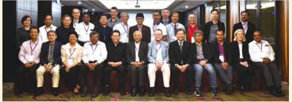
▲2018/04/26-28 Asia Affinity Alliance 亞太區總幹事聯盟—台灣聖經公會