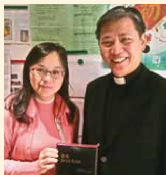
▲2018/03/25 異象傳遞—新竹中正長老教會