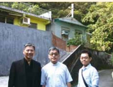
▲2018/05/06 異象傳遞—旗仔寮長老教會