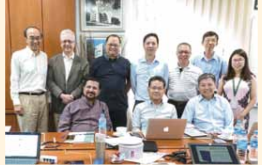
▲2018/03/06-09 CSF中文聖經協商會議—新加坡