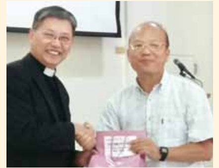
▲2018/05/02 異象傳遞—中華信義神學院