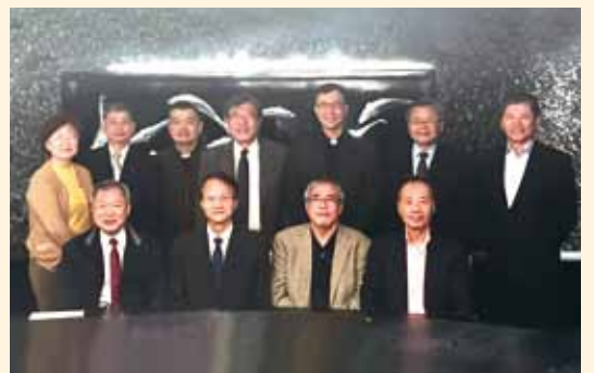
▲2018/03/27 第11屆第一次董事會—海峽會館