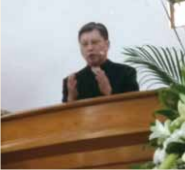
▲2018/04/15 異象傳遞—竹南神召會