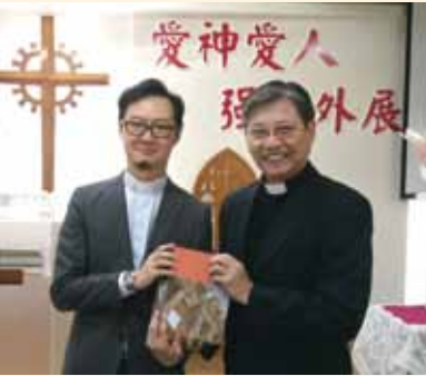
▲2018/04/29 異象傳遞—二重埔長老教會