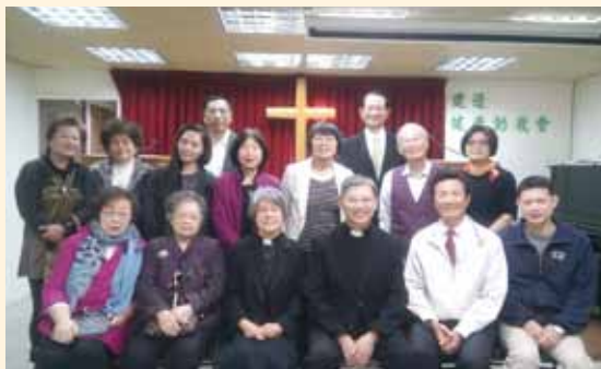
▲2018/04/08 異象傳遞—深坑長老教會