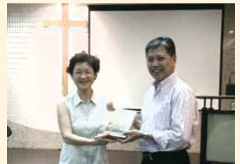
▲2018/05/10 異象傳遞—道生聖樂學院