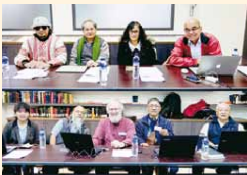
▲2018/03/22-23 鄒族、賽德克族PT8訓練會—台灣聖經公會