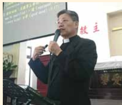
▲2018/05/06 異象傳遞—榮隆長老教會