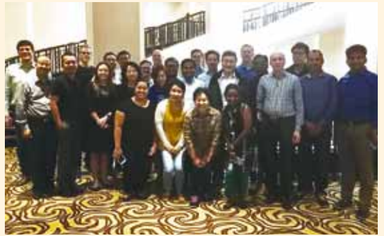
▲2018/02/26-03/02 Marketing cloud 研習會—泰國清邁