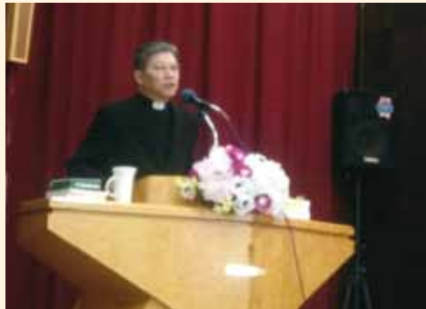
▲2018/03/11 異象傳遞—自強基督教板橋浸禮聖經會