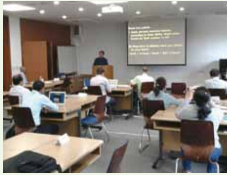
▲6/18-23 庫存管理訓練會-韓國首爾