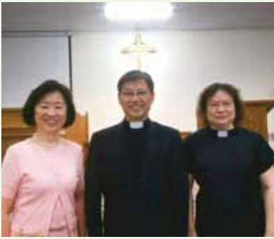
▲6/4 異象傳遞-后里長老教會