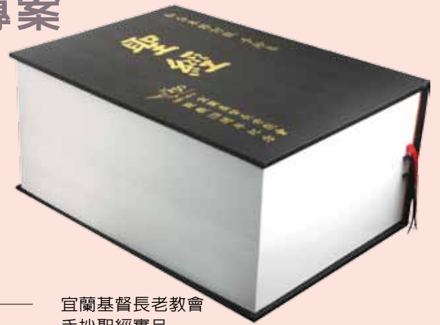
宜蘭基督長老教會 手抄聖經實品