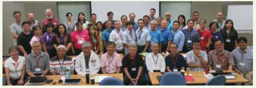
▲8/21-28 翻譯者&PT8研習會—北捷北投會館