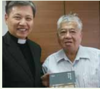
▲8/6 異象傳遞—台北 基督教迦南會北部大專團契