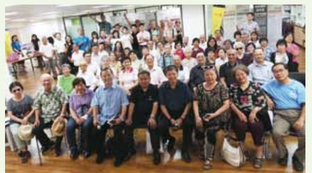
▲7/24 大台北同工聯禱會-台灣聖經公會