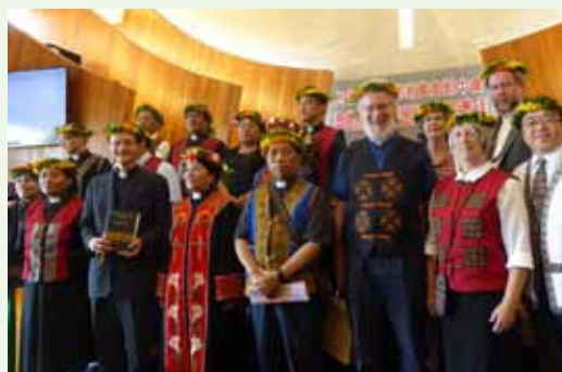
▲7/11 魯凱語聖經出版感恩禮拜-屏東好茶教會