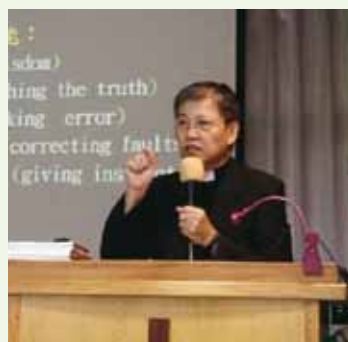
▲7/23 異象傳遞-新社磐石教會