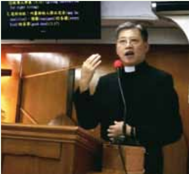
▲6/25 異象傳遞-台北崇真堂