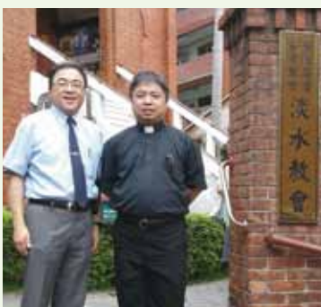
▲7/16 請安報告-淡水長老教會