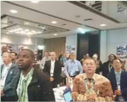
▲7/2-7 Roundtable高峰會議-澳洲雪梨