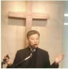
▲7/30 異象傳遞—台北 宣道會大安福音堂