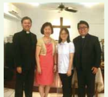
▲7/16 異象傳遞-中壢新興聖經教會