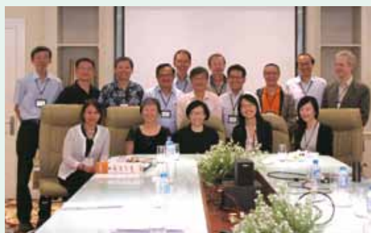
▲2016/02/23-24 CSF中文聖經協商會議