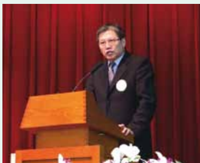
▲2016/01/11 北中星中議會請安報告