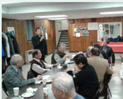
▲2016/01/03 長島台灣歸正教會