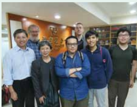
▲2015/12/11 政治大學語言所來訪