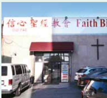
▲2016/01/05 拜訪信心聖經教會