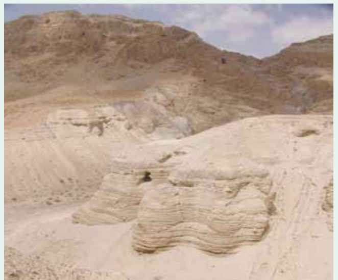
發現「死海古卷」的昆蘭洞窟

施洗約翰雖然於主後28/29年便為希律·安提帕（主前21年—主後39年）所處死，他所產生的運動並未因此而終結，他的門徒繼續傳佈敬虔與公義的信息，並施行約翰的洗禮，因而在猶太人當中形成另一個次團體。從徒18:25；19:1-7可知，在施洗約翰被處死超過25