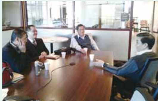
▲2016/01/06 拜訪美東基督使者協會