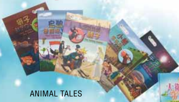
ANIMAL TALES 動物說故事(中英對照) 600元