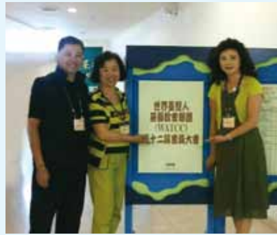
▲ 10/20~22世界台灣人教會聯盟