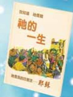
P-HELIVED-H 祂的一生 200元