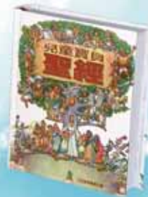
TCPS-C63P 兒童寶貝聖經 -人物故事 700元