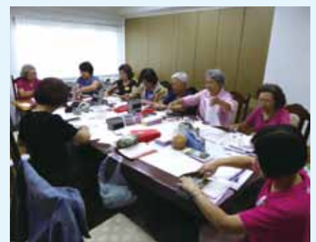
▲ 11/23~26 志工協助寄送事工