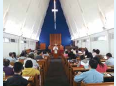
▲ 10/31 東門詮釋講座