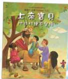
TCPS-063 上帝寶貝 地球村繪本聖經 350元