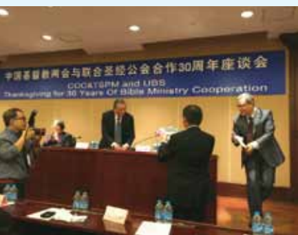
▲ 11/8中國基督教兩會與聯合聖經公會合作30周年座談會