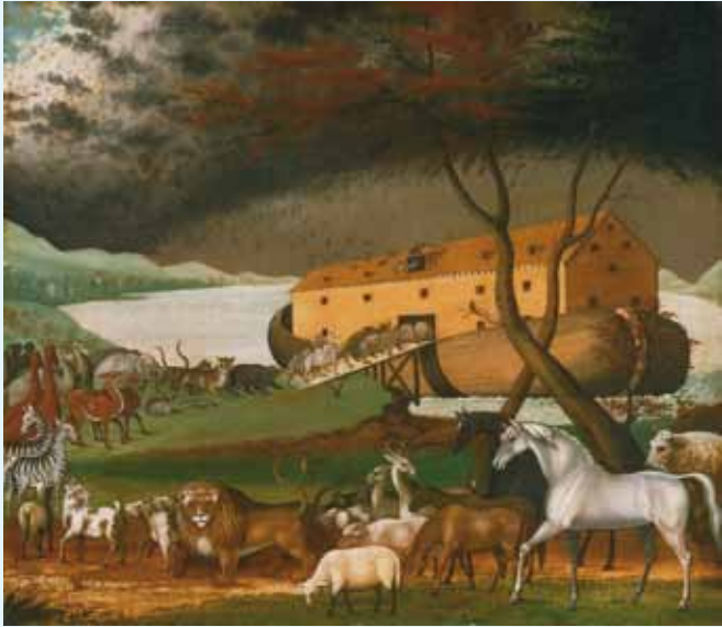
挪亞方舟。該圖為美國貴格會牧師暨畫家希克斯（Edward Hicks，主後1780-1849年）於1846年所繪，描繪洪水來臨前，地上的牲畜與飛鳥依次進入挪亞所造的方舟（見7:1-16的場景）。該圖現藏於美國費城美術館（Philadelphia Museum of Art, Philadelphia, U.S.A.）。