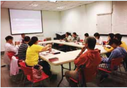
▲ 10/19於中華威克理夫翻譯會分享會