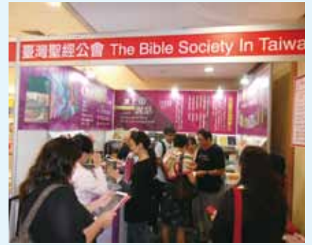
▲ 10/22~27 台北基督教書展