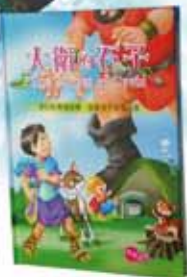
RCUNRS DAVID 大衛的石子 (中英對照) 400元