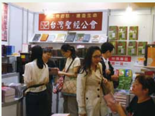
▲ 10/21~10/28全國基督教書展，台灣聖經公會攤位。