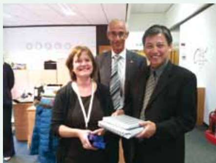
▲ 10/10拜訪聯合聖經公會（英國Swindon）。