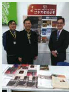
▲ 10/6~10/9都柏林「全歐教牧及教會領袖研討會」，本會設攤推廣中文研讀本。