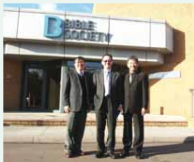
▲ 10/10拜訪位於Swindon的英國聖經公會。