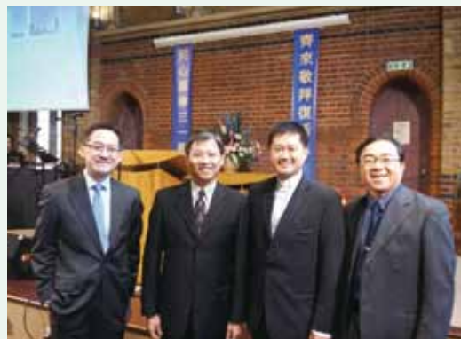
▲ 10/12拜訪倫敦中華基督教會蘇豪福音堂