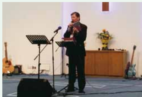
▲ 10/6~10/9都柏林「全歐教牧及教會領袖研討會」，本會報告請安。