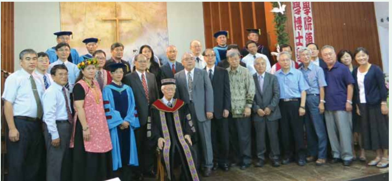
▲ 玉山神學院牧長同工和全台各地來參加盛會的牧長與駱博士合影。

9月22日駱博士接受玉山神學院的榮譽神學博士學位，不僅感謝一路相伴的親朋好友們，更是將一切榮耀歸給上帝。☑