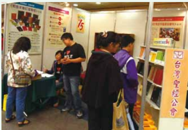
▲ 台北基督教書展實況